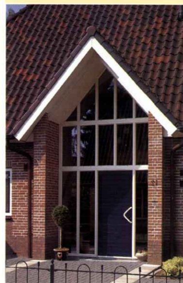
Deze schitterende ranke TOPLINE entree is uitgevoerd met alle inbraakwerende voorzieningen.