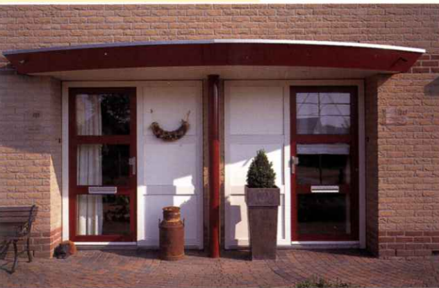
Ook de entree kan VEKA volledig voor haar rekening nemen. Informeer naar de zeer uiteenlopende mogelijkheden.

De kunststof kozijnprofielen van VEKA worden op grote schaal toegepast, in de meest uiteenlopende bouwstijlen. Geen wonder. Want VEKA profielen bieden niet alleen ongekend veel praktische voordelen, ze